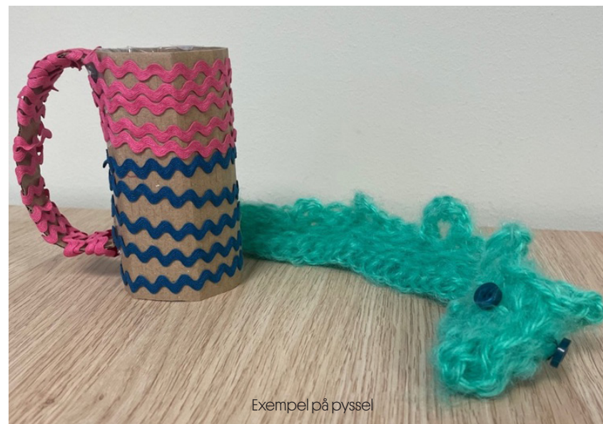
Exempel på pyssel

När ni pratar om föreställningen under pysslandet kan du med fördel utgå från Riksteaterns analysmodell En väv av tecken . Inspiration till mer föreställningsspecifika frågor hittar du längre fram i lärarhandledningen under rubriken ”Vänskap i förändring”.