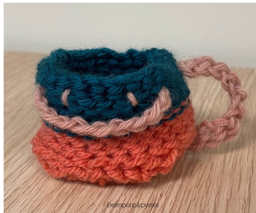
Exempel på pyssel